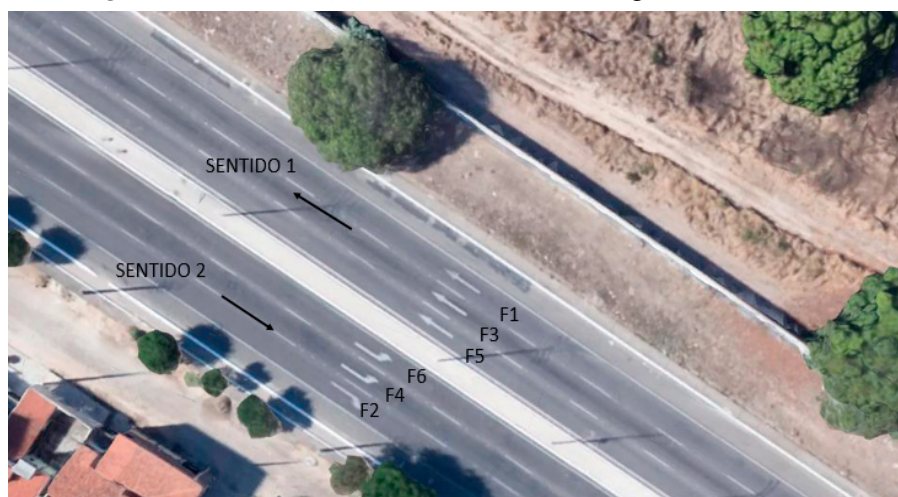
Figura 3. Numeração das faixas de tráfego e os sentidos

Almeida (2018) ressalta que os melhores resultados do levantamento foram obtidos com velocidades entre 60 e 80 km/h. Todavia, o levantamento realizado nessa pesquisa foi feito a uma velocidade média de 57 km/h, pois a velocidade máxima permitida na maior parte do trecho avaliado era de 60 km/h. Por outro lado, Sayers et al. (1986) e Karamihas e Sayers (1998) defendem que a velocidade para avaliação com equipamentos do tipo resposta deve ser limitada a 25 km/h. Assim, entende-se que a medição realizada apresenta-se com velocidades adequadas. Para um melhor entendimento da análise comparativa dos dados levantados, as faixas foram numeradas conforme ilustra a Figura 3.