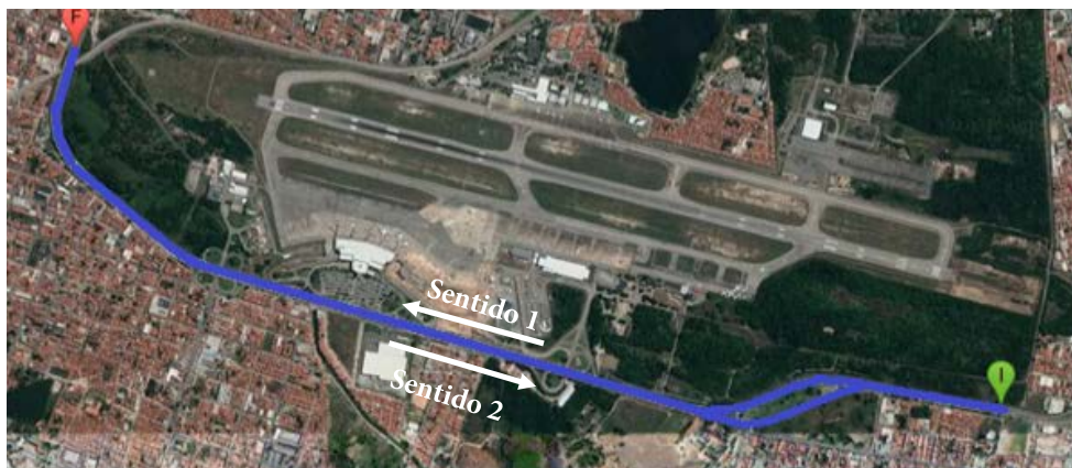
Figura 2. Trecho com 4,1 km de extensão avaliado

respectivamente, representam o início e o final do levantamento para as faixas de tráfego do Sentido 1, e são, respectivamente, o final e início do levantamento do Sentido 2.