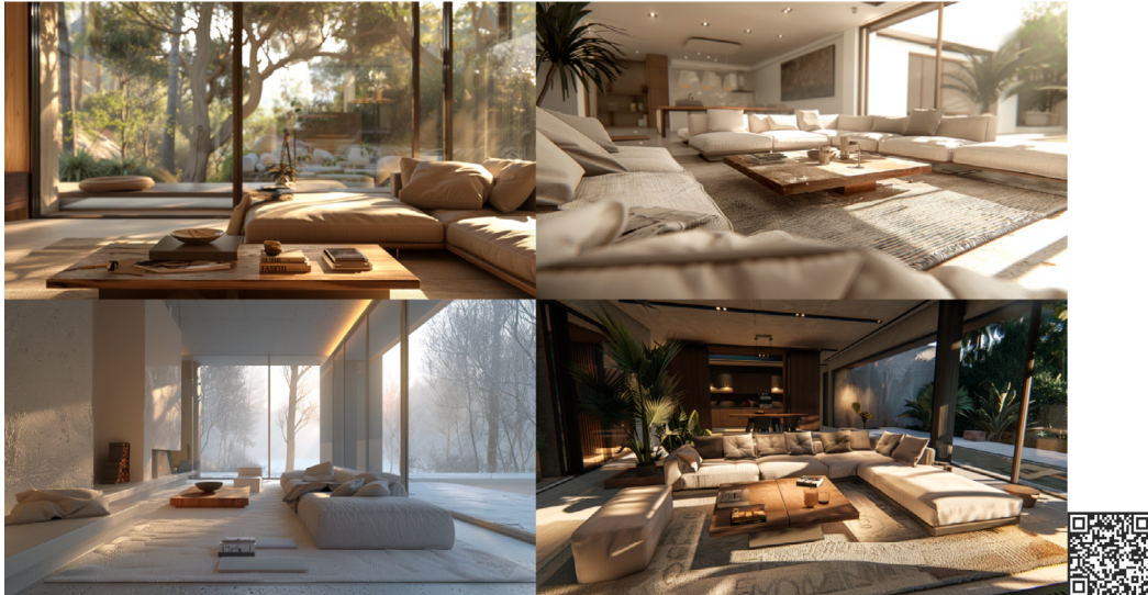
Figura 05. Resultado para o prompt da Landscape Architecture