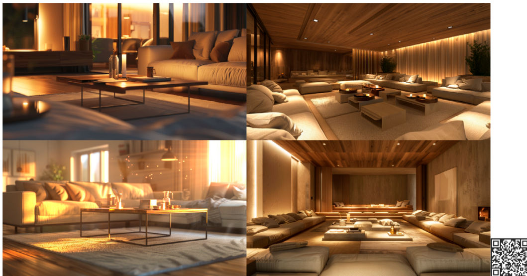
Figura 04. Resultado para o prompt da altArch